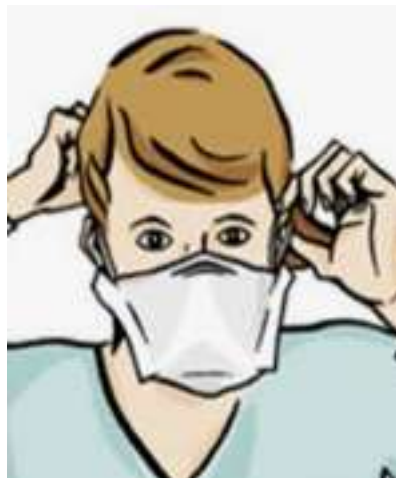
Figure 12 — Retrait du masque en le tenant le plus possible par le jeu de brides