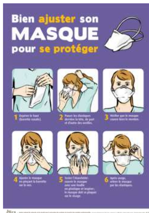
Figure 10 — Exemple d'affiche décrivant la mise en place du masque et le contrôle d'étanchéité (INRS : http://www.inrs.fr/media.html?refINRS=A%20759 )

NOTE Le masque barrière ne doit pas comporter des soupape(s) inspiratoire(s) et/ou expiratoire(s).