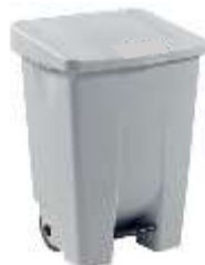
Figure 13 — Exemple de poubelle avec couvercle et à commande non manuelle

Les masques barrières doivent être jetés dans une poubelle munie d'un sac plastique (de préférence avec couvercle et à commande non manuelle, voir Figure 14). Un double emballage est recommandé pour préserver le contenu du premier sac en cas de déchirure du sac extérieur, lors de la collecte.