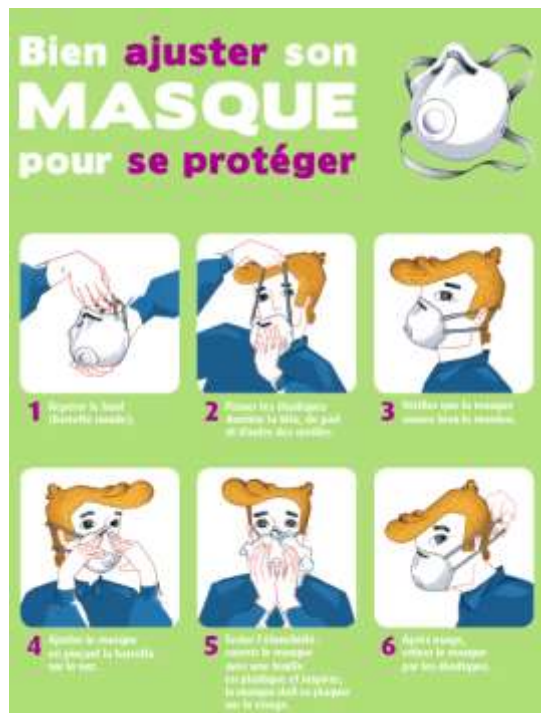
Figure 10 — Exemple d'affiche décrivant la mise en place du masque et le contrôle d'étanchéité (INRS : http://www.inrs.fr/media.html?refINRS=A%20758 )

EXEMPLE Exemples d'affiches décrivant la mise en place du masque et le contrôle d'étanchéité.