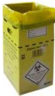
Figure 14 — Exemple de poubelle pour déchets biologiques

Les masques barrières souillés peuvent être jetés dans les poubelles pour déchets biologiques (Figure 15).