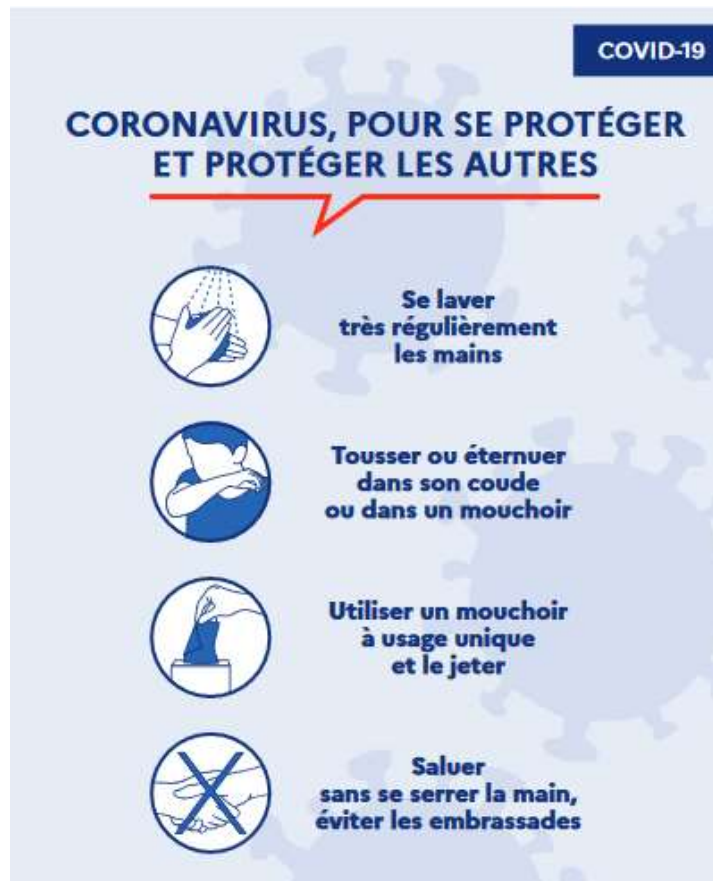
Figure 15 — Gestes barrières COVID-19

Les consignes sanitaires sont présentées sur le site du Gouvernement Français : https://www.gouvernement.fr/info-coronavirus .