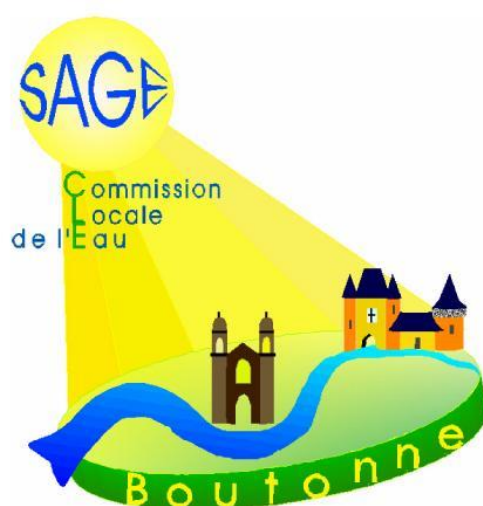
Schéma d'Aménagement et de Gestion des Eaux de la Boutonne